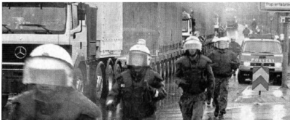
Im März nach dem Stopp, Gemmrigheim

Atommüll-Transport aus GKN nach Sellafield bestimmt. Die Behälter sind inzwischen beladen.